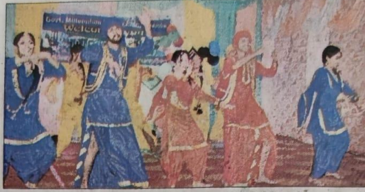
राजकीय सहस्राब्दी बहुतकनीकी संस्थान चंबा में पारितोषिक वितरण समारोह में सांस्कृतिक कार्यक्रम प्रस्तुत करते विद्यार्थी।