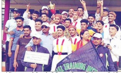
जोगिंद्रनगर : आई.टी.आई. की जिला स्तरीय 15वीं खेलकूद प्रतियोगिता के समापन पर चैंपियन बनी आई.टी.आई. जोगिंद्रनगर की टीम मुख्यातिथि के साथ सामूहिक चित्र में।