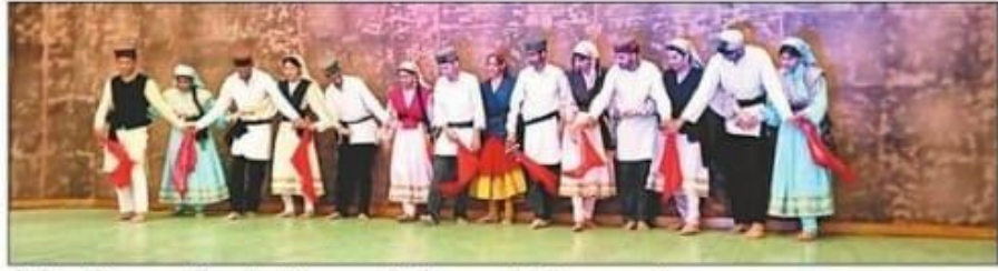
बहुतकनीकी महाविद्यालय हमीरपुर में वार्षिक उत्सव के दौरान प्रस्तुति देते छात्र-छात्राएं।