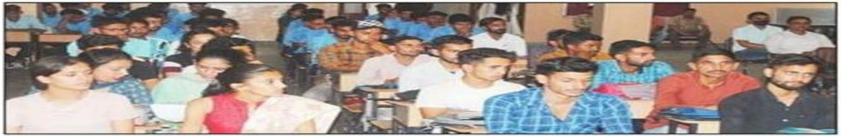
मंडी आईटीआई में प्रधानमंत्री नेशनल अप्रेंटिसशिप मेला में भाग लेते युवक और युवतियां।